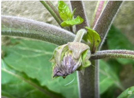
Afbeelding 8 Wolfskers Jacobgasthuissteeg.

In de Jacobsgasthuissteeg (komt uit op de Springweg) groeiden op vijf plaatsen Wolfskers. Eén aan het begin van de steeg links. Eén klein exemplaar rechts waar de steeg verbreedt tot een pleintje. Op het pleintje groeit Wolfskers met vijf stengels uit de grond tegen de westmuur. En nog een fors exemplaar in de tuis van nummer 7 en een kleintje langs de muur.