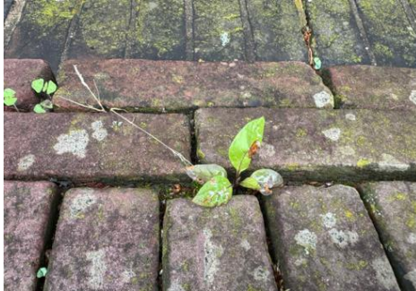
Afbeelding 4 Wolfkers Hartingstraat 4 klein exemplaar.

Een groot exemplaar groeit met stengel tussen het rooster door, zie afbeelding 3. Vlakbij de Grote plant nog twee kleine exemplaren, zie afbeelding 4.