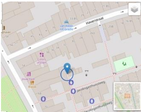
Kaart 2 Vijf groeiplaatsen in de Gasthuissteeg van Wolfskers.