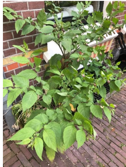
Afbeelding 3 Wolfkers Hartingstraat 4 grote exemplaar.