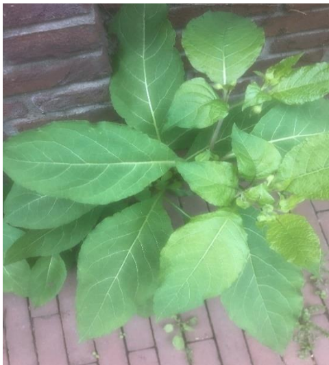
Afbeelding 6 Wolfskers Inktpot Moreelsepark tegen de blinde muur bij de parkeerplaats.

Tegenover de muur in een plantenbak tegen de Inktpot staat een groot exemplaar van ca. 1m hoog.