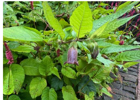
Afbeelding 5 Wolfskers In een plantenbak tegen de Inktpot.