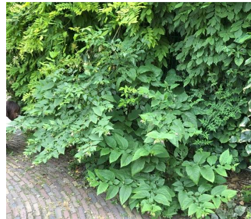
Afbeelding 9 Wolfskers tegen de westmuur van het pleintje.