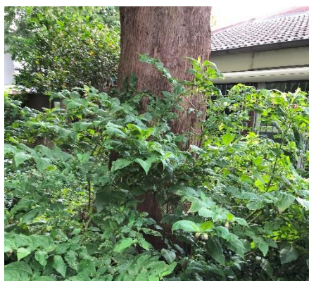
Afbeelding 2 Wolfskers rond een boom in de Vrouwjutenstraat