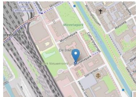
Kaart 1 Groeiplaats Wolfskers Moreelsepark