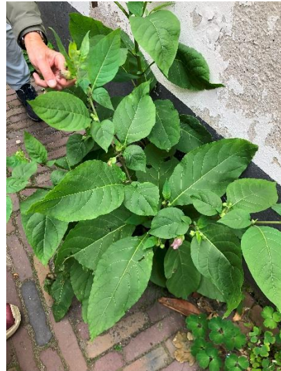
Afbeelding 7 Wolfskers aan het begin van de Jacobgasthuissteeg