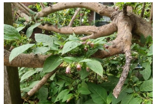
Afbeelding 10 Wolfskers in de tuin van Jacobsgasthuisstraat nr. 7