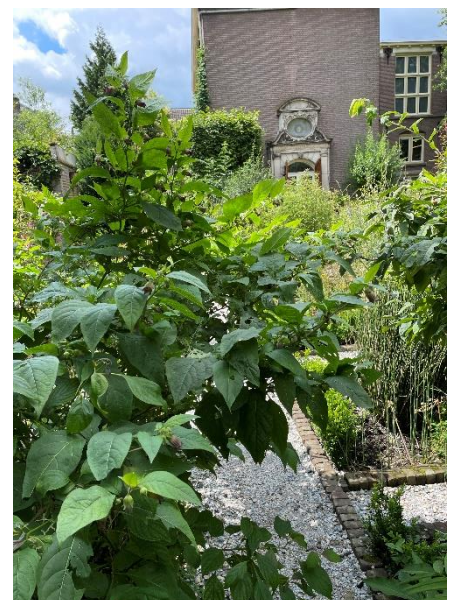
Afbeelding 1 Wolfskers Oude Hortus