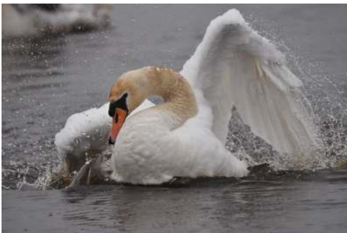
Knobbelzwaan