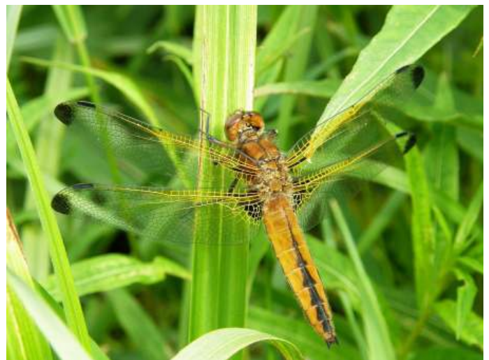
Bruine korenbout

Vorig jaar is het idee ontstaan om enkele weken voor het afdelingsweekend een korte veldcursus te organiseren over een soortgroep waar ook op het afdelingsweekend aandacht naar uit zal gaan. Op zaterdag 8 juni zal er een cursus zijn over libellen in Park Bloeyendaal. Die is uiteraard voor iedereen, ongeacht of je naar het afdelingsweekend komt.