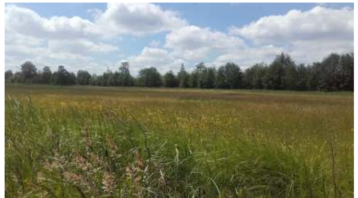
Hel, in het Utrechtse deel van het Binnenveld