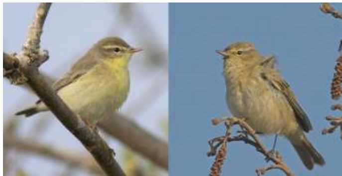
Fitis (links) Tjiftjaf (rechts)

Koolmees – Pimpelmees, Fitis – Tjiftjaf, Winterkoning – Roodborst, Boomkruiper – Boomklever, Zwartkop – Tuinfluiter, Graspieper – Veldleeuwerik, Rietzanger - Kleine karekiet, Snor – Sprinkhaanzanger, Bosrietzanger – Spotvogel, Porseleinhoen – Waterral, Wulp – Kluut, Tureluur - Zwarte ruiter, en lijst is uiteraard uit te breiden.