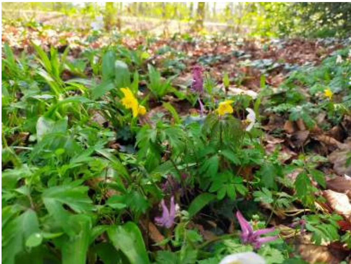
Bostulp en Vingerhelmbloem

Oosterse sterhyacint en de gele Bosanemoon konden we bewonderen. En ook hier werden we verrast door de vogels: baltsende IJsvogeltjes zagen enkelen van ons rondvliegen.