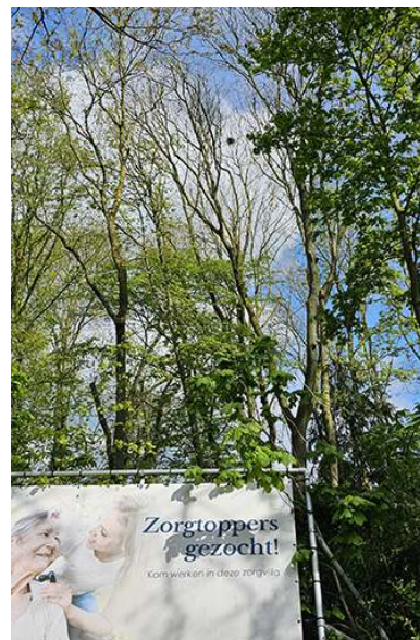
Zorgtoppers gezocht! (Spes Nostra). Maar ook: Topzorgers gezocht! In dit geval voor het eenzame roekennest in de top van de boom

De cijfers in het zwart tonen het verloop van het aantal nesten van de actieve kolonies. Na een stijging van de afgelopen jaren is het totaal aantal nesten enigszins teruggelopen. Het is nog te vroeg om te spreken van een tendens. Het is normaal dat het aantal nesten per kolonie jaarlijks flink fluctueert. Pas uit de lange termijn kunnen conclusies getrokken worden.