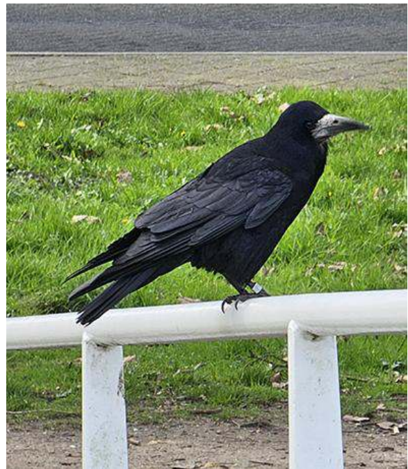
Een Roek op de brug over de Heldammer singel

Sinds 2017 tel ik jaarlijks tijdens de broedperiode het aantal roekennesten in de Gemeente Utrecht. Roeken zijn koloniebroeders, dus het is in principe vrij makkelijk om de boomgroepen waarin ze broeden te vinden. De eerste twee kolonies die ik vond (langs de Europaweg en de Electronweg) waren na 2019 verlaten; daarna trof ik tot vorig jaar nog drie locaties aan: Hindersteinlaan (centrum Vleuten), A12/Meerndijk (langs snelweg) en Heldammersingel (bij winkelcentrum Veldhuizen). Het totaal aantal nesten bedroeg 85.