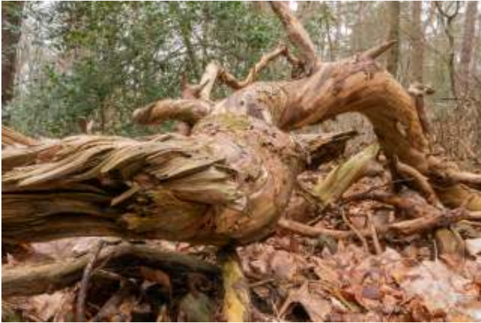
Getordeerd hout van de Grove den

Bij Grove dennen is het hout soms getordeerd; we zagen dat goed bij een aantal dode stammen en takken. Hier zijn geen goede grenen planken en palen van te maken!