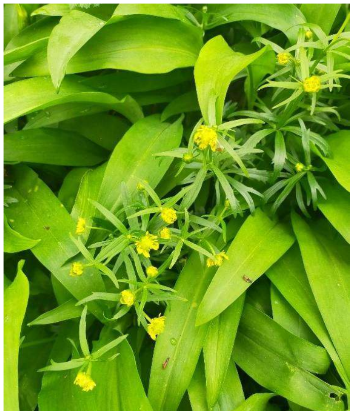
Gulden boterbloem

Verder in het park: Look zonder look, Daslook, Pinksterbloem,