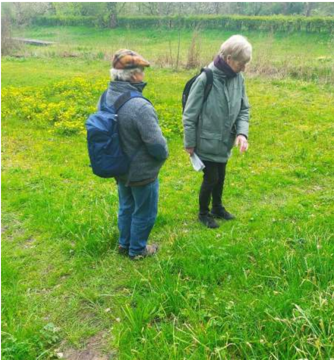
Schraal grasland Bloeyendael