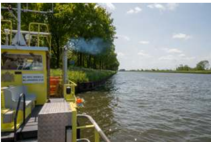
Veerpont De Aa

We volgen de Vecht door Oud-Zuilen, Maarssen, langs Breukelen (en langs Gunterstein). Heerlijk fietsen in de zon, lekker rustig op de weg. Vanaf nu wordt het beeld meer landelijk, we zijn een beetje op de oostelijke grens van het Groene Hart.