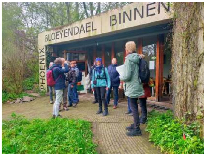
Deelnemers excursie Bloeyendael

Zij had voor deze wandeling het één en ander op papier gezet over geschiedenis en andere wetenswaardigheden over het park en uit dat verhaal mochten we bij dit stukje putten.