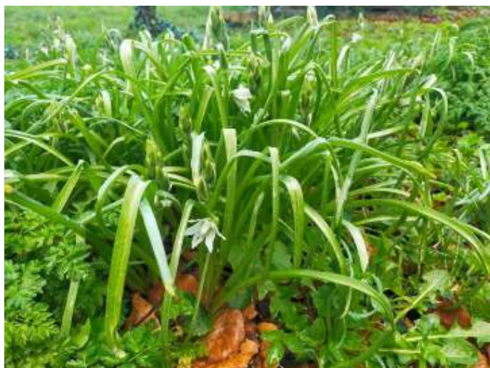
Knikkende vogelmelk

bomen en struiken. En ook jonge stekken van de Prachtframboos die zich rijkelijk had uitgezaaid in het gebied.