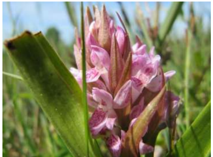
Rietorchis of Vleeskleurige orchis?

Bij mensen in en rond Buren beter bekend als 'de Put', een natuurgebied net buiten Buren. Het terrein is gevormd door afgraving van klei voor de productie van stenen. De plassen zijn ontstaan door het zuigen van zand en door ingrijpen van Staatsbosbeheer. Het resultaat is een bijzonder gebied met plassen van verschillende diepten en een kalkhoudende zandige afzetting als voedingsbodem voor speciale planten. Verder zijn er diverse hagen, struweel en bomen.