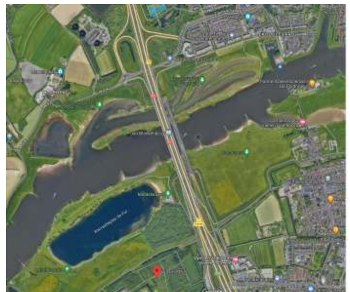
Pontje Nieuwegein-Vianen, Pontwaard, Middelwaard en het Viaanse Bos

Start bij de ingang van het museum om 10.00 uur. Je moet zelf zorgen voor een entreekaartje.