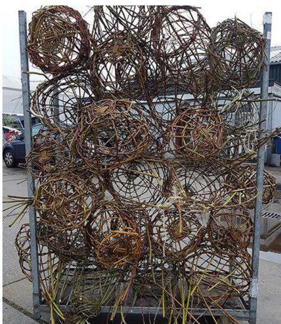
Wilgentenenbollen op kar

Trouwe volgers van het Nieuws op de website zagen het misschien voorbijkomen: er werden vrijwilligers opgeroepen om mee te werken aan het vlechten van druppelvormige mandjes van wilgentenen. Deze activiteit was snel volgeboekt, en op zondagmiddag 5 februari ging een 20-tal vrijwilligers aan de slag. Na een korte scholing mochten we zelf gaan ploeteren; wat zijn die wilgentenen stevig als je ze moet buigen. Buurthuis 3 Krone aan de Oudegracht lag al snel bezaaid met takken. Aan het eind van de middag waren er een 20-tal manden gevlochten: 1e doel gehaald!