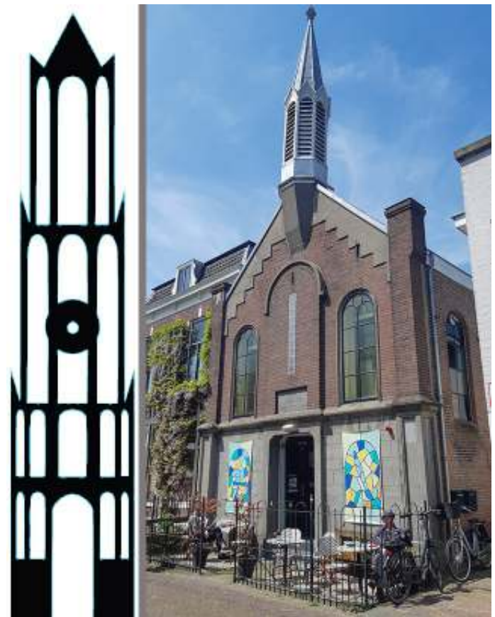
Abrona Koffie & Kunst, Kockengen

En dan fietsen we weer op huis aan. Via kasteel de Haar, Maximapark en Groenedijk duiken we de stad weer in. Een paar uur gefietst, 45 km afgelegd in de zon, het leven van pensionados is zo gek nog niet!