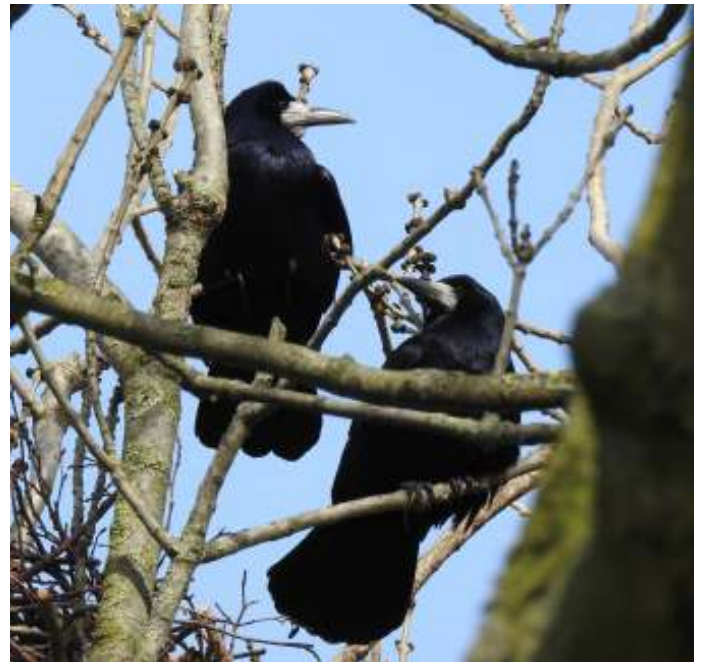
Twee Roeken

Hetzelfde heb ik gedaan bij de kolonie langs de A12/Meerndijk. Al meteen na aankomst, om circa 19:30 uur zag ik ca. 12 Roeken vliegend boven, in en uit de groep koloniebomen. Na een paar minuten vlogen alle vogels weg, vooral in oostelijke richting. Twintig minuten later kwam een groep van circa 20 Roeken aanvliegen. Ze vlogen niet in de bomen, maar bleven merendeels zitten op een paar T-vormige lantaarnpalen langs de snelweg. Na verloop van tijd verdwenen ze een voor een, ook in oostelijke richting. Ik heb gewacht tot het pikdonker was, maar voor mij