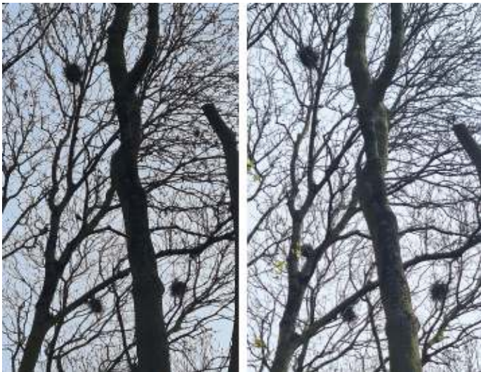
Links: de hele kolonie, 3 nesten. Rechts: op 25 april ineens een nest erbij.