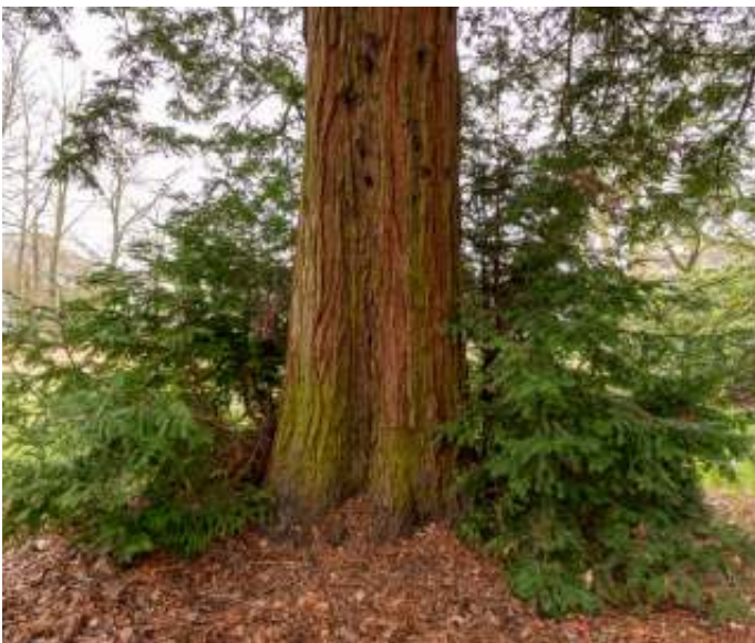
Opslag van de Westelijke kustsequoia

We hadden geen loep nodig om de oren van een beuk te kunnen zien, aan weerskanten van een plakoksel. Ook de luchtwortels