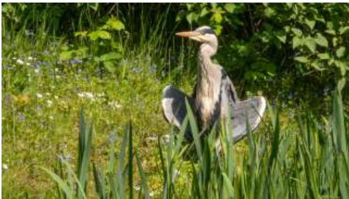
Reiger bij slot Zuylen

Met de handige app Fietsknoop ( www.fietsknoop.nl/ ) plannen we onze route, schrijven de knooppunten op een stukje schilderstape en plakken dat op ons stuur. Mobieltje aan de andere kant op het stuur met OsmAnd, een open source navigatie app ( https://osmand.net/ ), en het is onmogelijk om nog te verdwalen.