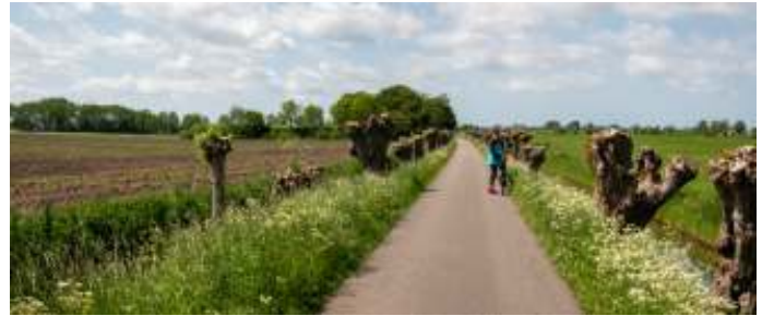
't Laantje

Tussen Breukelen en Loenen laten we ons door veerpontje de Aa over het Amsterdam-Rijnkanaal zetten, richting Nieuwer ter Aa. Een prachtig fietspad met Knotwilg wordt gevormd door 't Laantje, een stukje Groene Hart op weg naar Portengense Brug.