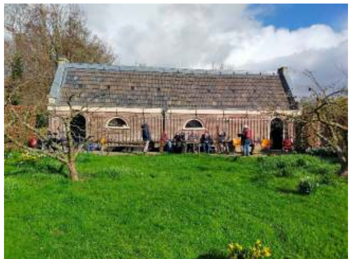
Schuur Gunterstein

Kortom, een leuke en zeer leerzame excursie. Meer weten: kijk naar de documenten op de KNNV-website.