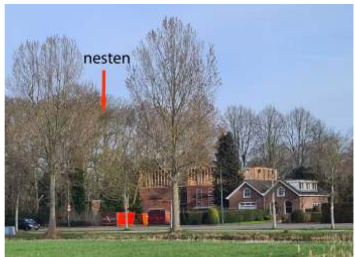
Vlakbij de nesten zijn bouwactiviteiten

Maar het kwam regelmatig voor dat 5 à 10 minuten lang geen enkele vogel in de kolonie aanwezig was. Predatoren of eierrovers hadden dan vrij spel en de Roeken profiteerden dus niet van de beschermende werking wanneer er zoals bij grotere kolonies altijd wel vogels aanwezig zijn. Ik hou mijn hart vast voor volgend jaar. De reden voor het geringe aantal nesten is wellicht gelegen in het feit dat ze bezig zijn met het plaatsen van een extra verdieping op een naastgelegen gebouw (zie de foto). De vogels worden dan niet, zoals door zuster Lucia, drie keer per dag verstoord, maar voortdurend. Dat vogels storingsgevoelig zijn, merkte ik onder andere bij de kolonie bij de A12/Meerndijk. Door er alleen al rustig langs te lopen vlogen ze vaak massaal op en verlieten de bomen.