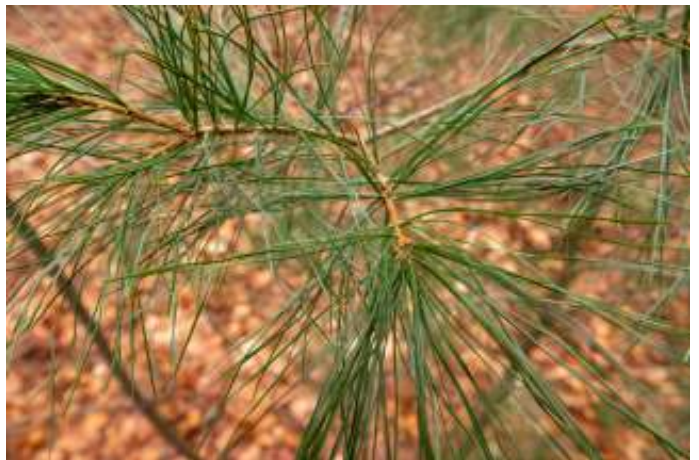
Weymouthden, 5 naalden bij elkaar

Ook staat op de site een determinatietabel voor een aantal soorten, en een kaartje van de route door het landgoed waarop de plek van bijzondere bomen is aangegeven. Ik beperk me hier tot het noemen van een aantal zaken die mij opvielen.