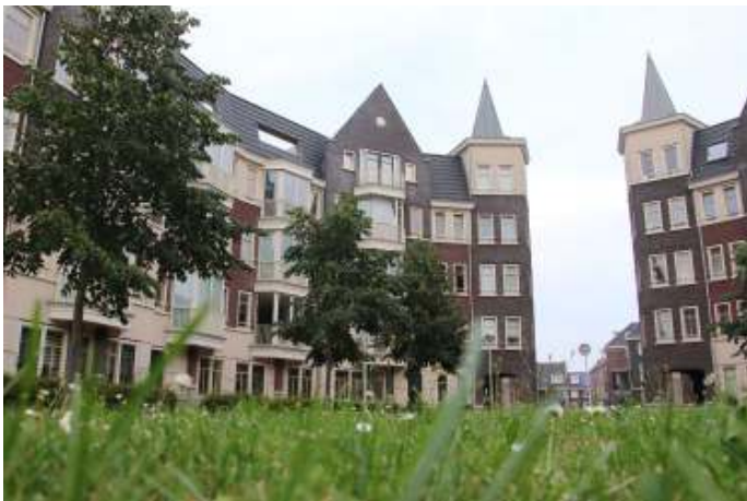
In het gazon groeien 45 plantensoorten

Ik woon in een straat met een lang en smal grasveld voor het appartementsgebouw. De afmetingen van het veld zijn ongeveer 72 m bij 7 m, dus ruim 500 are. Ons appartement bevindt zich op de tweede verdieping, onze ooghoogte is ongeveer 8 meter boven straatniveau. Vanaf die hoogte oogt het grasveld als een grote groene vlakte, met als je goed kijkt een paar gele stipjes van paardenbloemen en witte stipjes van madeliefjes. Verder is er niets bijzonders te zien. De plantsoendienst hanteert een strikt maaibeheer. In het seizoen wordt gemiddeld eenmaal per twee weken gemaaid. Het gras groeit nooit echt hoog, dus ik kan beter spreken van een gazon dan van een grasveld.