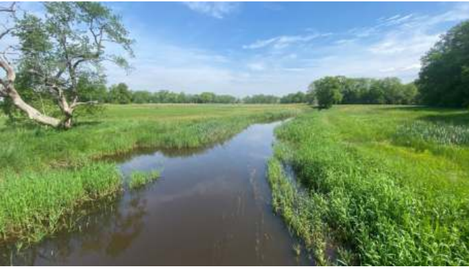
Taarlosche Diep bij Oudemolen