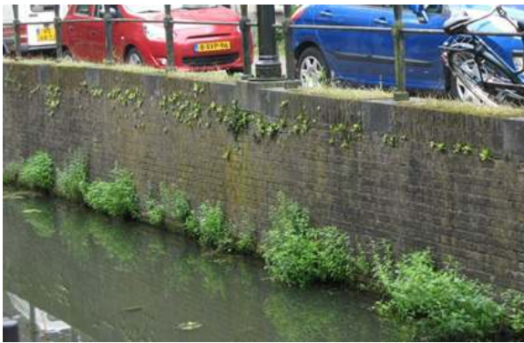
Muurvegetatie op de kademuur van de Gruttersdijk

In Amelisweerd zijn drie van de vier geplande inventarisaties doorgegaan; de Beurs op 10 juni, de Oude Kweek op 17 juni en het Vagantenpad op 8 juli. De resultaten zijn aan gemeente Utrecht doorgegeven. Deze gegevens worden gebruikt voor het beheer van deze hooilandjes.