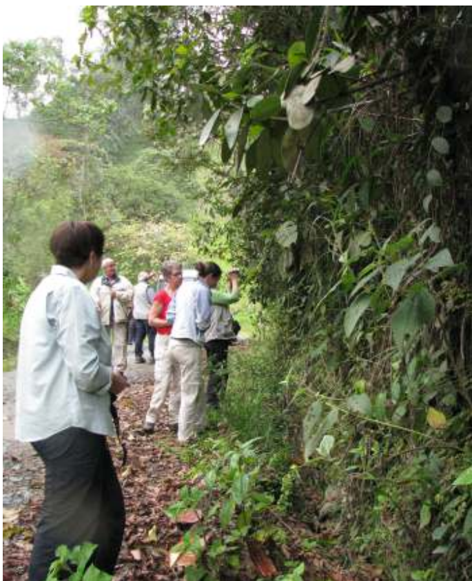
Zoeken in de berm

Ik ben zo'n 20 jaar bezig met orchideeën op de vensterbank. Werk twee dagen in de week in de orchideeënkassen van de Botanische Tuinen Utrecht. Heb twee keer met een groepje lotgenoten een reis gemaakt door Ecuador op zoek langs wegen en paden, in heg en steg, in bossen en op bergpassen naar orchideeën. Overigens, ongemerkt stuit je dan ook op allerlei andere prachtige dingen, planten, vogels, enz.