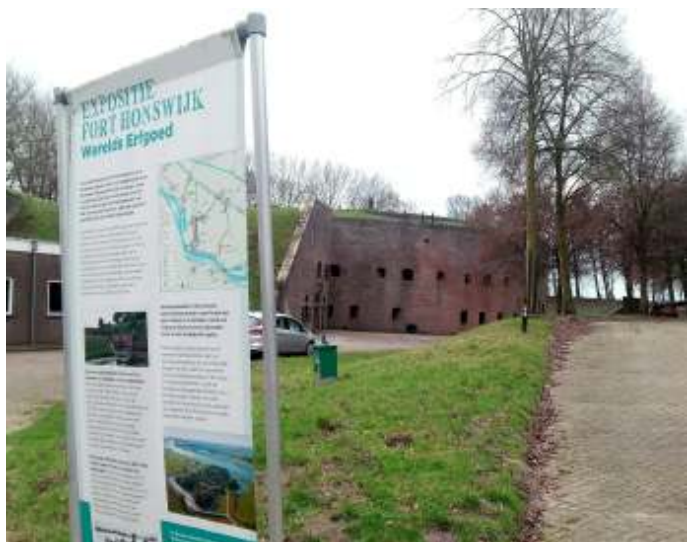
Fort Honswijk

datiekanaal, waar we langs lopen, geschikte oevers. Ook komen we door een 'verdrongen bos' met vlonders daar doorheen. Om zo nog meer een beeld te krijgen wat de waterlinie deed met het landelijke gebied.