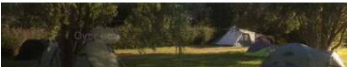
Header KNNV Kampeergroep

Ik hoop jullie ook eens tegen te komen op een van de kampeerweekenden van de KG.