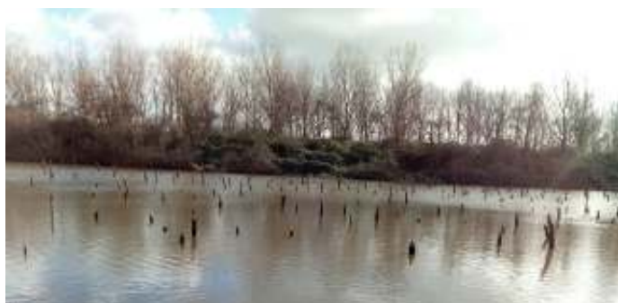
Fort Honswijk

Vertrek/Samenkomst: Parkeerplaats bij fort WKU (Werk aan de Korte Uitweg), Lange Uitweg 42A, Tull en 't Waal. Voor de auto raad ik navigatie aan, of 'route' aanklikken op website WKU. Er naar toe fietsen kan eventueel ook, via Houten rond de 20 km. Ik kan eventueel bemiddelen m.b.t. de logistiek, meerijden etc. Opgave: via aanmeldformulier utrecht.knnv.nl/agenda/ vóór dinsdag 5 april.