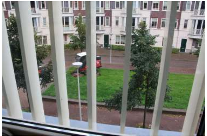
Het gazon gezien vanuit de erker. De rode maaier is druk bezig

Ondanks de soortenrijkdom aan kruiden geeft het grasveld een saaie monotone indruk. Zo'n grote groene vlakte wordt schaam-