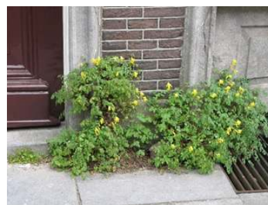
Gele helmblom, een beschermde stoeplant

Het voorstel is om de contributie met vroegbetaalkorting licht te verhogen en de datumgrens voor vroegbetaling te vervroegen naar 1 februari, zie tabel.