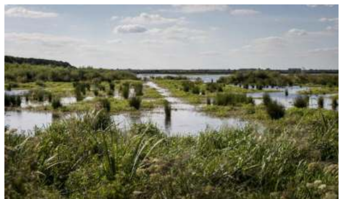
Westerbroekstermadepolder en Kropswolderbuitenpolder

Daarna kunnen we (naar behoefte) aan de westzijde van het Zuidlaardermeer nog enkele andere vogelhutten bezoeken met mooi uitzicht op de polders. Hier broeden en jagen Visdieven, Zwarte stern en de Witwangstern. Ook Zomertaling, Rietzanger en Blauwborst zijn hier te zien.