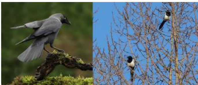
Kauw en Ekster

Kauwen en Eksters zijn de meest algemene vogels in de wijk waar ik woon. Regelmatig vliegt ook een meeuw over, soms een Zwarte kraai, nu en dan zit een kwetterende Zwarte roodstaart op een richel en afgelopen jaren zijn een koppel Turkse tortels van de partij. Vanuit een luie stoel in de erker aan de voorkant van het appartement kan ik het vogelgebeuren in alle rust waarnemen, wetende dat alle vogels zich onbespied wanen. Meestal is er niets bijzonders te zien. Vogels landen regelmatig op het groene grasveld waar ik op uitkijk en beginnen dan stappend en pikkend te foerageren. Er lijkt maar weinig onderlinge interactie tussen de vogels op het veld, soortgenoot of niet.