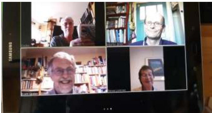
Bestuursvergadering in COVID-tijd

den. De eerste excursie die wordt gerapporteerd ging op 30 augustus 1903 naar de verdedigingswerken De Lunetten. Er werden toen 120 plantensoorten gevonden, waaronder Grote kroosvaren, Kleine wolfsmelk, Naakte lathyrus, Aardaker, Gevleugeld helmkruid, Moeraszoutgras en Slipbladige ooievaarsbek. Er werd door 10 mensen aan deelgenomen, een aantal waar we nu niet ontevreden over zouden zijn.