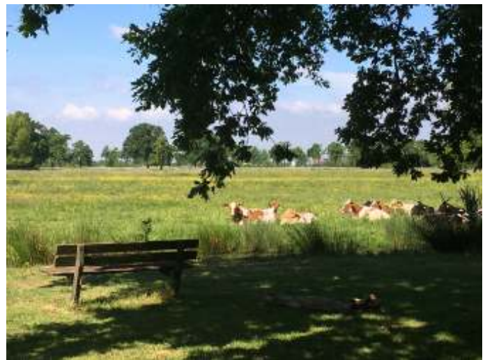
Ten noorden van Kasteel De Haar ligt het zogenaamde Klein Limburg. Hier wordt gestreefd naar een afwisselend en kleinschalig landschap waar zowel koeien als hooilandbeheer worden ingezet.