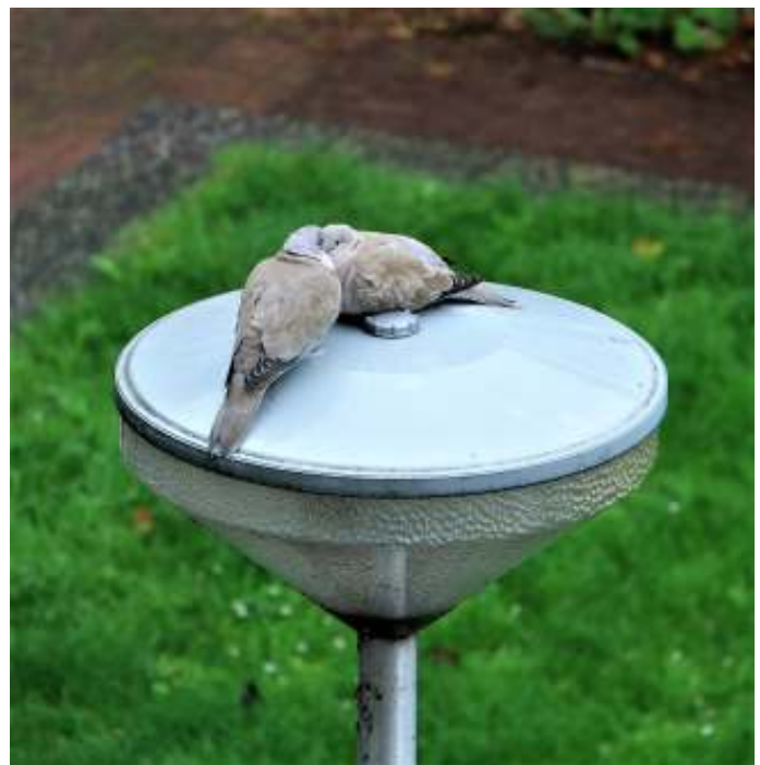
Turkse tortels zijn lief voor elkaar maar niet voor Eksters

Een ander opmerkelijk gedrag betreft dat tussen Turkse tortels en Eksters. Turkse tortels staan misschien bekend als vredelievende beestjes, maar ze kunnen bijzonder fel zijn. Niet zozeer tegenover elkaar, maar wel tegenover Eksters, die toch bepaald niet als doetjes bekend staan. Gedurende het hele broedseizoen van mei tot september zag ik een Turkse tortel verwoed een Ekster achternagaan, net zolang totdat de Ekster het opgaf en in een zijstraat verdween. Ongetwijfeld hebben Eksters als nestrovers onder de Turkse tortels een slechte reputatie. Het nest is niet meer dan een takkenbosje, dat maar weinig bescherming biedt aan de eieren. Om de populatie in stand te houden moeten de tortels wel doen aan actieve oorlogsvoering. Dat doen ze dan ook fanatiek. Kauwen zijn blijkbaar geen nestrovers. Als een koppeltje Turkse tortels plaatsneemt op de nok van het tegenoverliggende appartementsgebouw en een Kauw erbij in de buurt gaat zitten, vliegen na verloop van tijd de tortels weg en doen geen enkele poging om de Kauw te verjagen. Eigenlijk wist ik het wel: de Kauw is een van de meest vreedzame vogels.