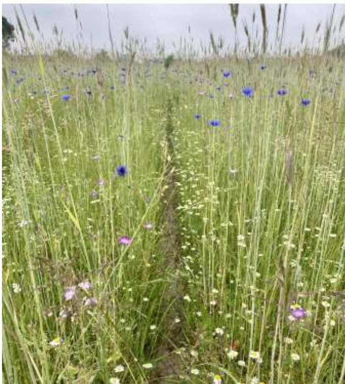
In de akkers van Haarzuilens is een grote afwisseling aanwezig van akkers, gewassen en akkerkruiden. Zowel in de akkers als op de randen staan veel kruiden. Op de foto onder andere Korenbloem en Bolderik.

Zowel in 2013 als in 2019 is de flora gekarteerd. Geconcludeerd kan worden dat soorten die minder hoge eisen stellen, nauwelijks in 2013 hier en daar aanwezig waren, nu sterk zijn uitge-