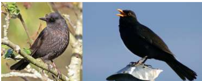
Juvenile en adulte Merel

Toch merk je af en toe wel dat de vogels elkaar niet helemaal onverschillig laten of soms zelfs helemaal niet. Een keer zag ik een tweetal merelmanneltjes lopen, voortdurend dicht bij elkaar. Eén van de twee, het grootste en zwartste, probeerde de ander steeds weg te jagen. Maar de ander bleef in de buurt en bleef hem volgen. Dat ging de hele tijd zo door, totdat ze uit het zicht waren verdwenen. Het was eind mei; jonge mannetjes lijken dan nog veel op vrouwtjes. Bovendien toonde de kleinste merel geen bedelgedrag om voedsel. Het waren dus twee volwassen merels. Maar ze leken ook niet te vechten om een vrouwtje. Dat was in geen velden of wegen te bekennen. Ik kon het gedrag niet ver-