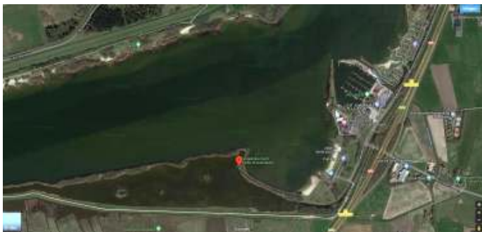
Vogelkijkscherm Delta Schuitenbeek

Op 11 december gaan we watervogels kijken bij het Nuldernauw. Het wordt een excursie met auto die alleen doorgaat als er voldoende auto's zijn. We starten de excursie bij Uitkijkpunt strand Nulde waar we kans maken op Kleine zwanen, IJsvogel en verschillende soorten eenden.