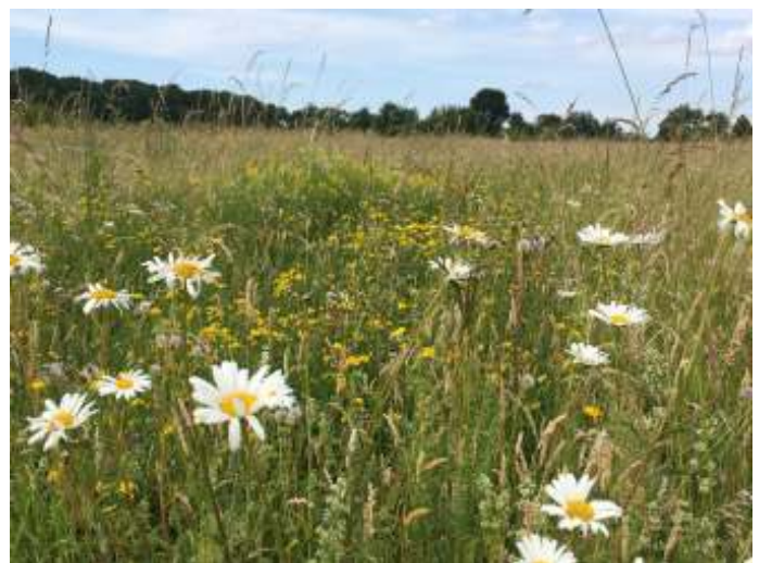
In het zuidwesten, tussen de zogenaamde fauna-akkers ontwikkelen zich graslanden met kenmerken van Glanshaverhooilanden

breid en verspreid in het akkercomplex voorkomen. Denk aan soorten als Rood guichelheil en Hondspeterselle. In 2019 zijn bijna 40 soorten akkerkruiden vastgesteld. Hiervan zijn er iets meer dan 20 geïntroduceerd. Ruim 30 soorten zijn kwalificerend voor het natuurbeleid en kruidenrijke akkers. In het gebied is een zogenaamd akkerreservaatje waar met zorg de verzamelde soorten zijn ingebracht. Op deze wijze wordt de (her)introductie begeleid. Van hieruit zijn soorten als Naakte lathyrus, Akkerboterbloem, Naaldenkervel en Bolderik in het gebied verspreid.