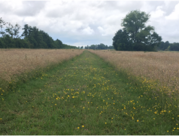
Door gefaseerd te maaien kunnen we toch verschralen en de witbol terugdringen én houden we voldoende ruimte voor kruiden en insecten. foto: Tim van den Broek peen.

Er wordt gewerkt met onder andere een pachter die in stroken maait, op verschillende momenten in het seizoen. Hierdoor hebben in de graslanden naast elkaar verschillende stadia van de hoogte van het gras. Zo is er altijd dekking en voedsel voor onder andere insecten. Dit is niet altijd eenvoudig te bereiken, want niet alle pachters kunnen en willen zo werken. Tenzij je er voor betaalt, maar dan wordt het natuurbeheer vrijwel onbetaalbaar. Als beheerder zoek je naar de meest efficiënte methode; praktisch en goed voor de natuur en toch betaalbaar. Vanuit de delen waar maaisel uitgestrooid is uit de Bijleveld zien we een inktvlek werking: de soorten verspreiden zich naar omliggende percelen. Denk hierbij aan soorten als Rietorchis, Kamgras, Grote ratelaar, Echte koekoeksbloem.