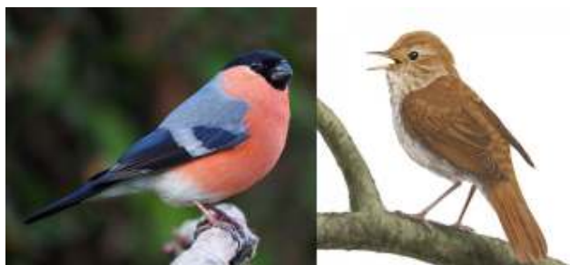
Goudvink en Nachtegaal