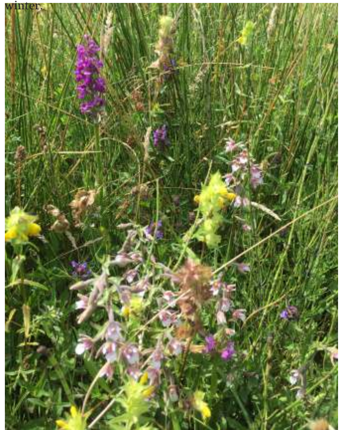
Sommige delen in het noordelijk deel van de Wielrevelt zijn afgeplagd en er is maaisel uitgestrooid vanuit het reservaat De Bijleveld. Op de foto onder andere Grote ratelaar, Moeraswespen- en Rietorchis. Deze soorten breiden zich uit naar de omliggende percelen.

De akkers met een faunadoelstelling zijn ingezaaid met diverse gewassen. In de beginjaren werd er geëxperimenteerd met soorten als Kool. De laatste jaren wordt er gebruik gemaakt van de zaadmengsels van het internationale Partridge project. Dit omvat meerjarige soorten of soorten die zich zelf uitzaaien zoals Honingklaver en Kaardebol. Ook worden er granen gezaaid die aan het eind van de winter blijven overstaan als voedsel. In combinatie met de struwelen en singels moeten ze zorgen voor een aantrekkelijk leefgebied voor vogels, zowel in zomer als