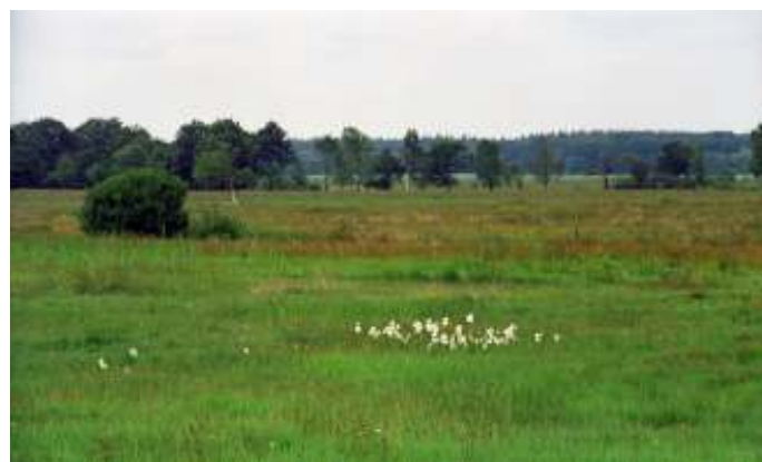
Stroomdal Drenthse Aa

In 2022 willen we weer een KNNV-weekend gaan organiseren. Het weekend zal gehouden worden in het Drenthse Aa-gebied. Gezien de huidige situatie is het voor de organisatie lastig in te schatten of er genoeg belangstelling is voor een KNNV-weekend. We willen graag inventariseren hoeveel mensen zin hebben om mee te gaan naar het KNNV-weekend in het Drenthse Aa-gebied. Ben je voornemens mee te gaan naar het KNNV-weekend, laat dat dan weten via https://utrecht.knnv.nl/agenda/vooraanmelding-knnv-weekend-drentse-aa-2022/ . Doe dat vóór 9 januari 2022. Bij voldoende belangstelling kunnen we de locatie gaan reserveren en het weekend gaan organiseren.